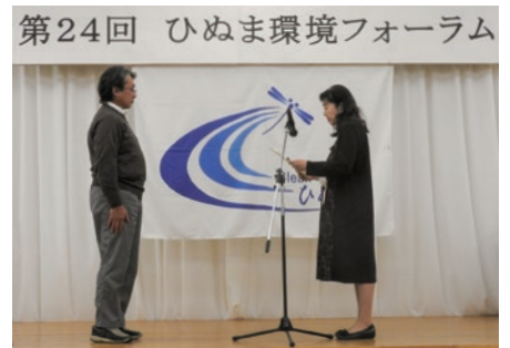
湖沼水質浄化活動功労者表彰