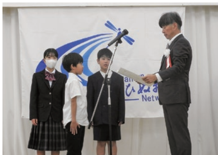
湖沼水質浄化ポスター表彰