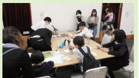
クリーンアップひぬまネットワーク事務局 オリジナルマグネット作成