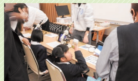
茨城県霞ヶ浦環境科学センター 電子顕微鏡でプランクトンの観察