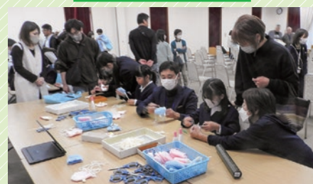
茨城県立茨城東高等学校 アクリルたわし作成