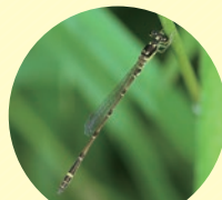
ヒヌマイトトンボ (オス)

連絡先 涸沼水鳥・湿地センター(展示施設) 管理事務所 電話:029(303)6530 FAX:029(303)6531