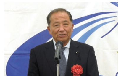
来賓あいさつ 長谷川 重幸 県議会議員