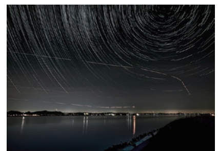
『雉もいるよ』 深作 正一 (大洗町)