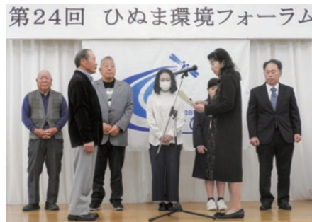
フォトコンテスト表彰